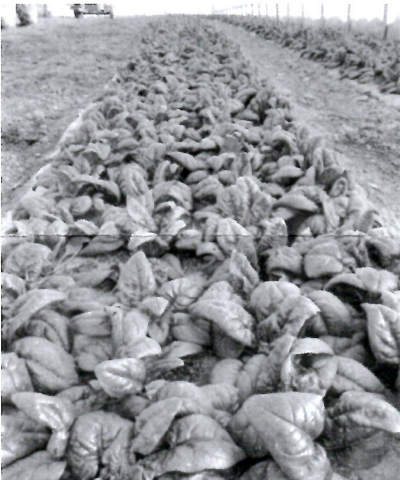
Une belle planche d'épinards

Il s'en est suivi une trêve de Noël de 15 jours pour tous les salariés qui ont repris le travail ce mardi 3 janvier.